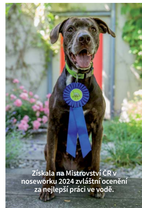
Získala na Mistrovství ČR v noseworku 2024 zvláštní ocenění za nejlepší práci ve vodě.