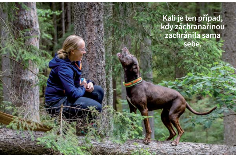
Kali je ten případ, kdy záchranářinou zachránila sama sebe.